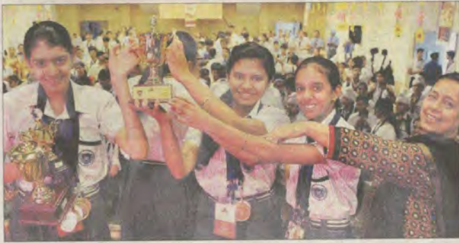
Students in a jubilant mood after winning the trophies on the concluding day of World Scholar's Cup at Learning Paths School, Mohali.