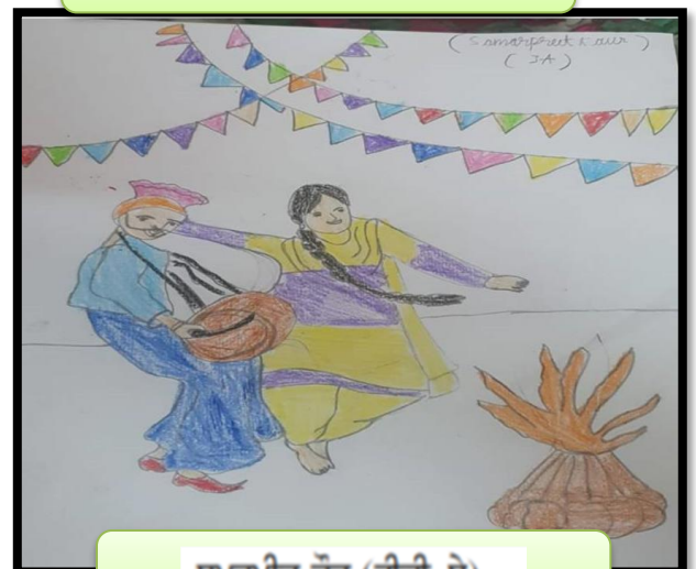
ਸਮਰਪ੍ਰੀਤ ਕੌਰ (ਤੀਜੀ-ਏ)