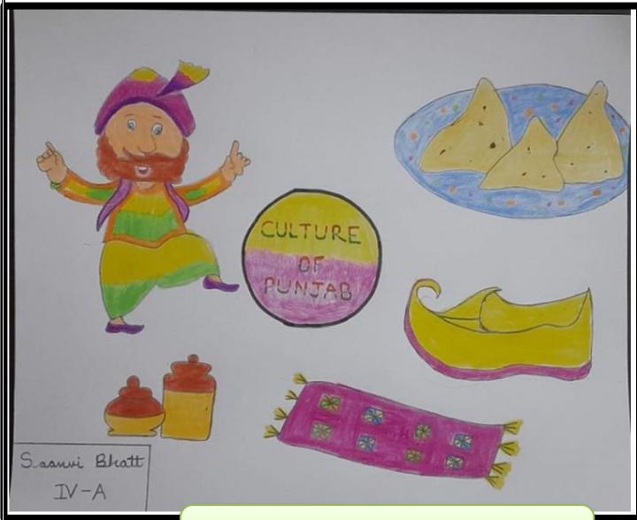
ਸਾਨਵੀ ਭੱਟ (ਚੌਥੀ-ਏ)