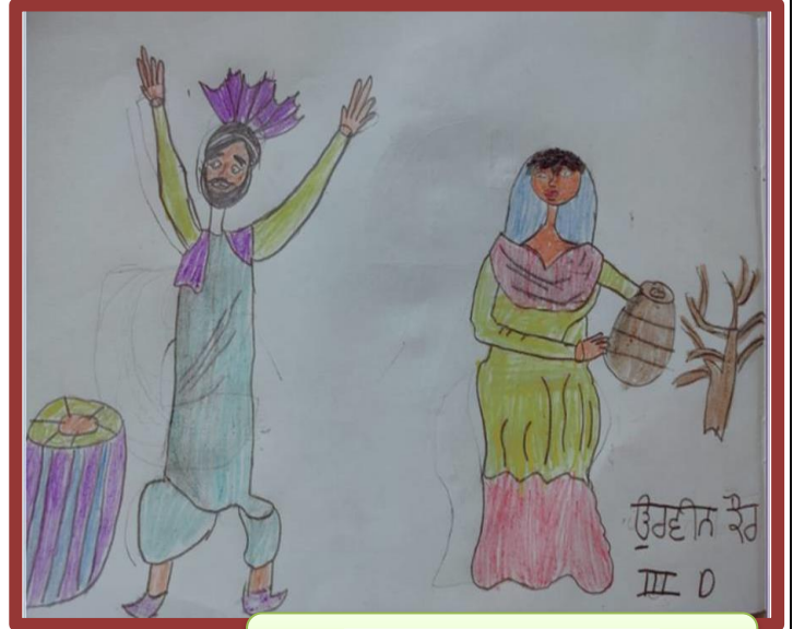
ਉਰਵੀਨ ਕੌਰ (ਤੀਜੀ-ਡੀ)